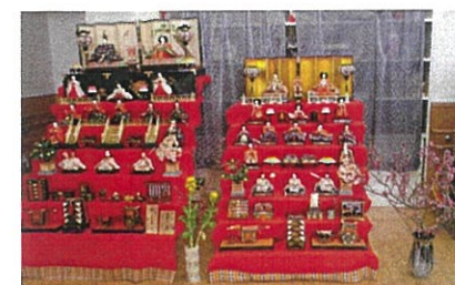
お雛様とちらし寿司