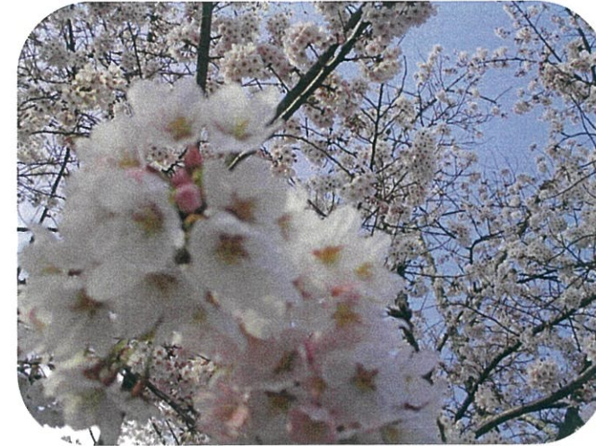
“夜の森公園の桜” ほぼ満開でした。