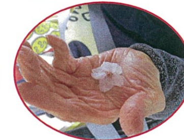
桜のお花かわいいですね！