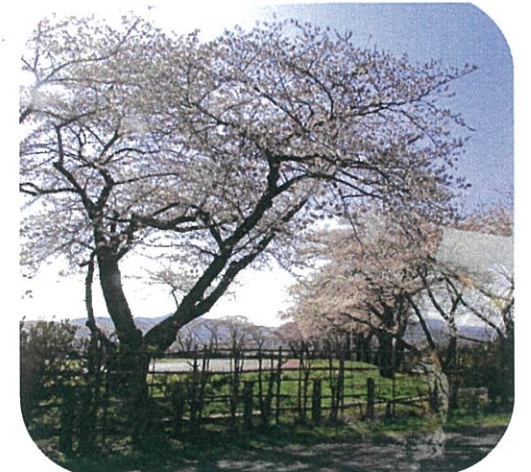
“陸上競技場の桜” 青空に映えてきれいでした。