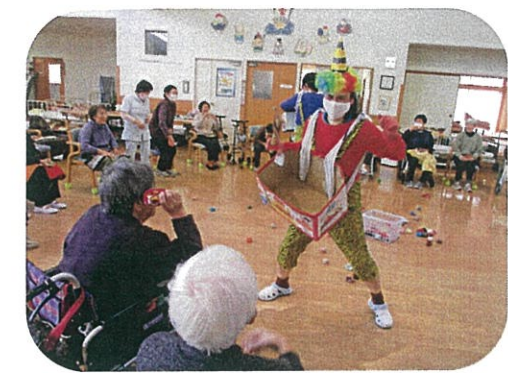
「鬼は一外〜！！福は一内〜！！」の掛け声とともに、厄払いをしました。