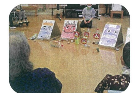
鬼の的にめがけてお手玉を投げるゲームを行いました。