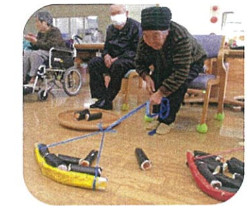
恵方巻きゲーム たくさんとれたら福もたくさん来るかも〜