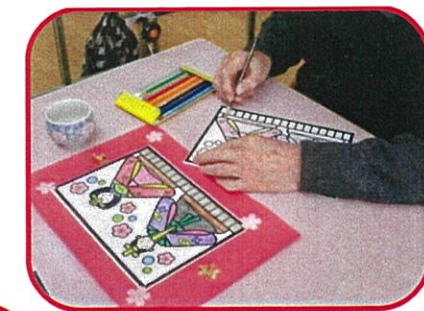
おひな様飾りをつくりました。