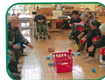
「玉入れゲーム」は、紅白に分かれ職員の引くカゴめがけてお手玉をいれます。

利用者さんのコミュニケーションを大切に、いろいろなゲームを行っています。職員と一緒に無理なく、楽しく行っています。