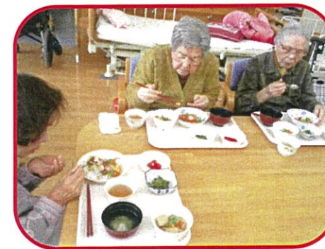
昼食には、ちらし寿司を召しあがっていただきました。