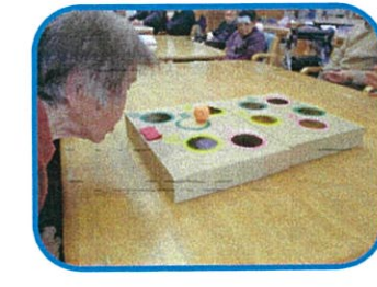
「吹いて吹いて」は、口腔機能レクでピンポン玉を吹いてボードの穴に入れ点数を競います。