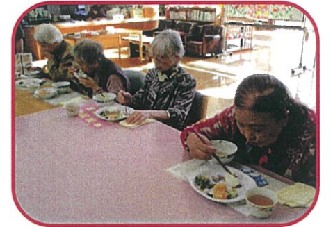
いも煮を囲んで楽しく食事中!

秋も深まりめっきり冷え込むようになりましたが、寒い日は温かいものが恋しくなりますね。しゃりん梅では、秋の味覚“いも煮汁”の大きな鍋を囲み皆さんで談笑しながらゆっくりと食べて、心も体も温まって頂きました。